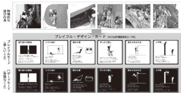
図1：子どもの遊び行為とプレイフル・デザイン・カードの表裏

前号（産業能率11-12月号）では、こどもOS研究会で開発したアイデア発想法を取り上げた。この発想法は子どもを対象とする製品（玩具や遊具）のみを開発するために考案されたものではなく、あくまでも大人の既存概念を覆すための手段として、子どもの特徴的な思考や行動を発想の触媒として利用するものである。しかし、今号で紹介するステップ5だけは、環境（空間）や製品の開発において考慮しなければならない、子どもが直面するハザード（潜在的な危険）について、「プレイフル・デザイン・カード」の裏面（ハザードモード・図1）を使って事前に予測する方法の説明である。