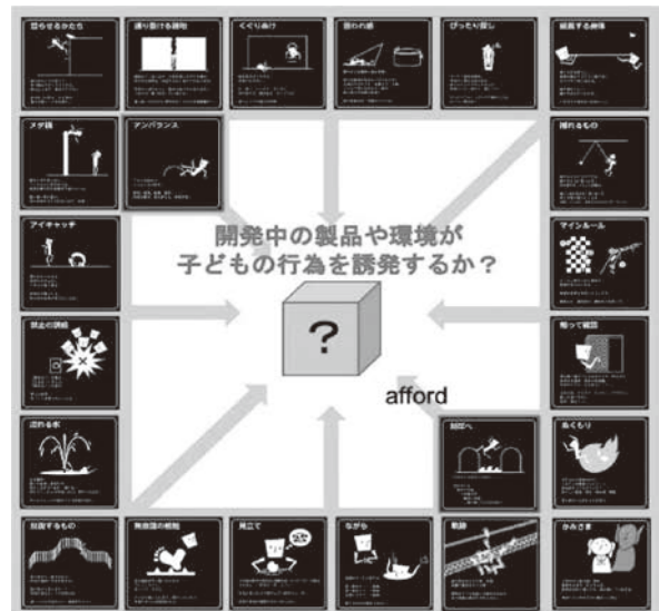
図3：プレイフル・デザイン・カードによるハザードの絞り込み

前号で「子どもの遊び行動を観察調査し、誰にでもよく見られる遊び行為の中から22種類を抽出した」と述べたが、この時、“楽しいこと”と“危険なこと”が表裏一体となるものを選択し、子どもの思考・行動言語としてランゲージ化を行っている。ステップ5では、カードの裏面（黒い方）を使い、開発中の製品や環境（空間）が、カードに示した子どもの行為を誘発するかどうかという観点に立って、ハザードの可能性を絞り込んでみる。（図3）