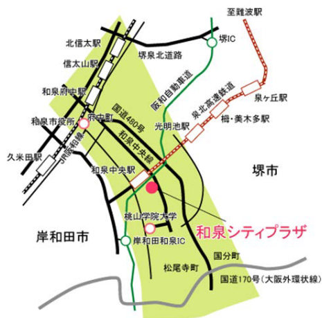
和泉シティプラザ 3階

【会場】和泉シティプラザ 3階 学習室4 (泉北高速鉄道 和泉中央駅より徒歩約3分)