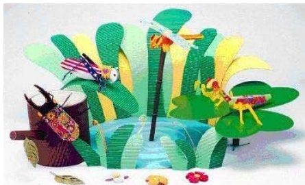
左: 知育・エコ コレクション ミルダン立体昆虫シリーズ 下: ダンボールを用いた“世界一弱いロボット” KAMILA 国際次世代ロボットフェア(ICRT JAPAN 2008)に出展