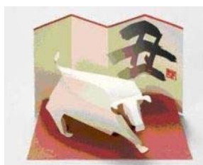
下: 紙細工年賀状 干支シリーズの紙細工年賀状 一枚の紙からデザイン性あふれる立体の干支の動物が作れる 送って楽しく、もらってうれしい 年賀状90円で送れます。 オリジナルの印刷もOK