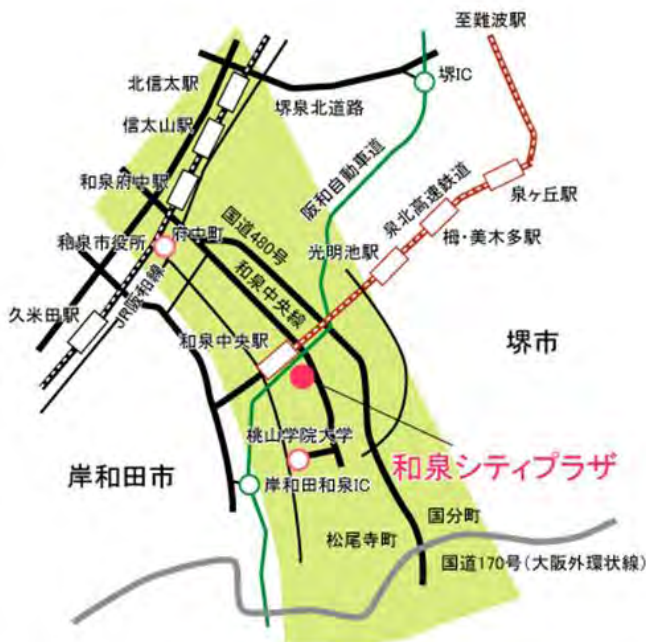
和泉シティプラザ 3階

会場：和泉シティプラザ 3階 レセプションホール（泉北高速鉄道 和泉中央駅より徒歩約3分）